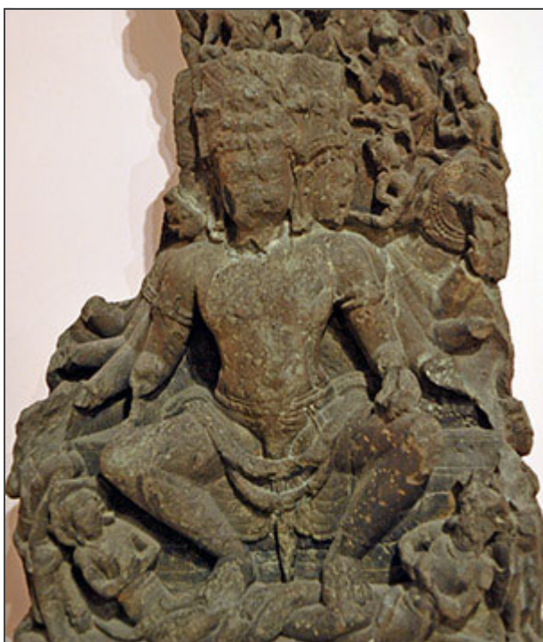
Višnu Višvarúpa („všech forem“). Maitraka, Gudžaráť, 7. století. V expozici National Museum Delhi.

Ještě důležitější co do výsledku se ukázala synkretická tendence, označovaná pojmem avatára . Toto slovo znamená „sestup“, přesněji „pozemské ztělesnění božstva k užítku lidí“. Starší literatura uvádí čtyři avatáry Nárájany-Višnua, později jejich počet dosahuje dvaceti devíti.