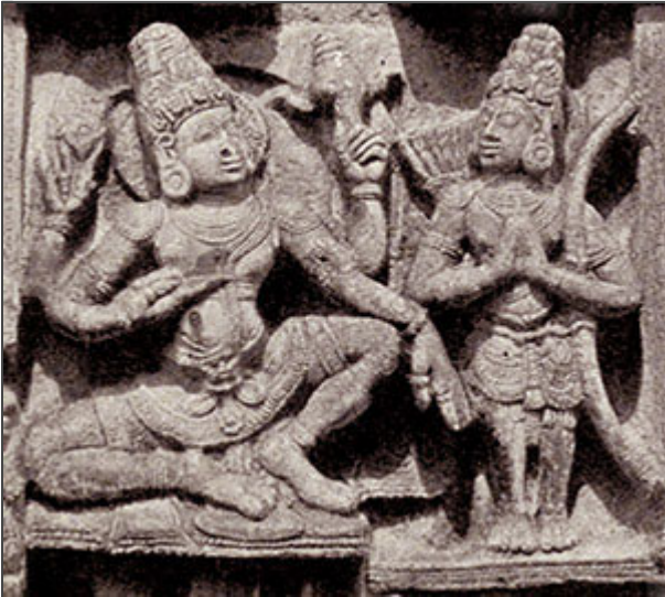
Párthasárathi (Kršna jako vozataj) vykládá Bhagavad-gítu Ardžunovi.

Chrámový výjev, Pušpagiri. Z knihy South Indian Images of Gods and Goddesses (1916).